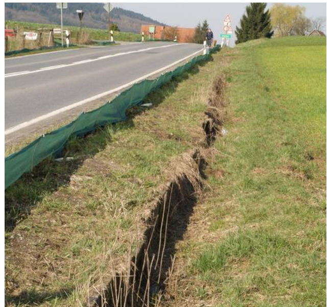
Amphibienzaun an der Haller Str., davor die alte verfallene Leiteinrichtung (Bild von 2006)