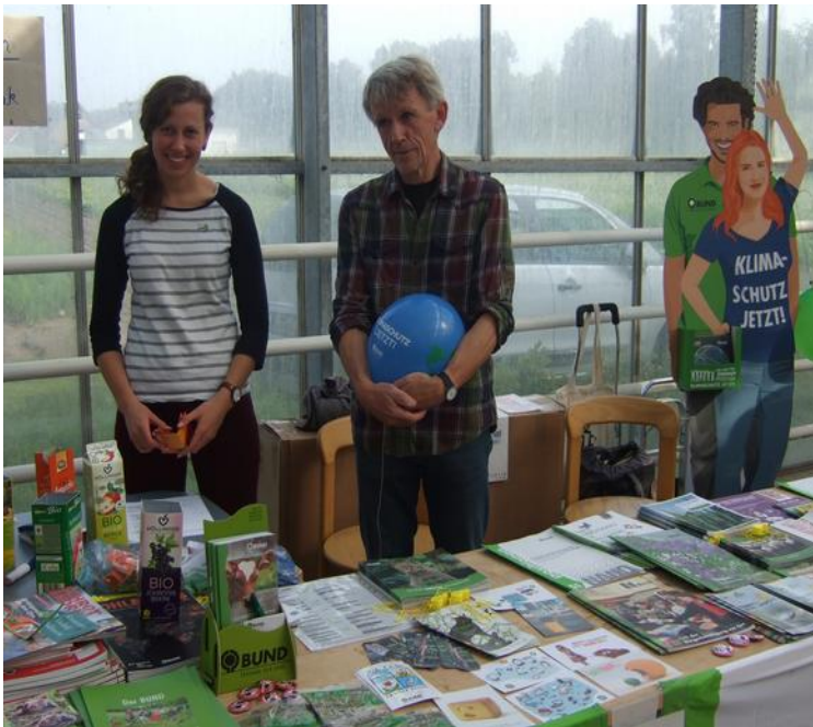
auf dem Kiebitzhof