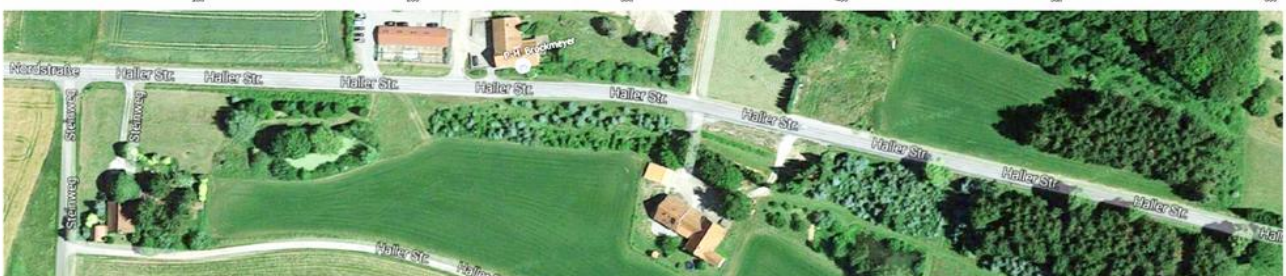
Verteilung der Erdkröten entlang der Straße Das Maximum liegt jeweils auf Höhe der Teiche.