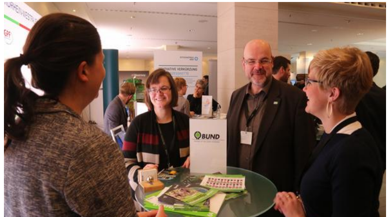
Deutscher Nachhaltigkeitstag