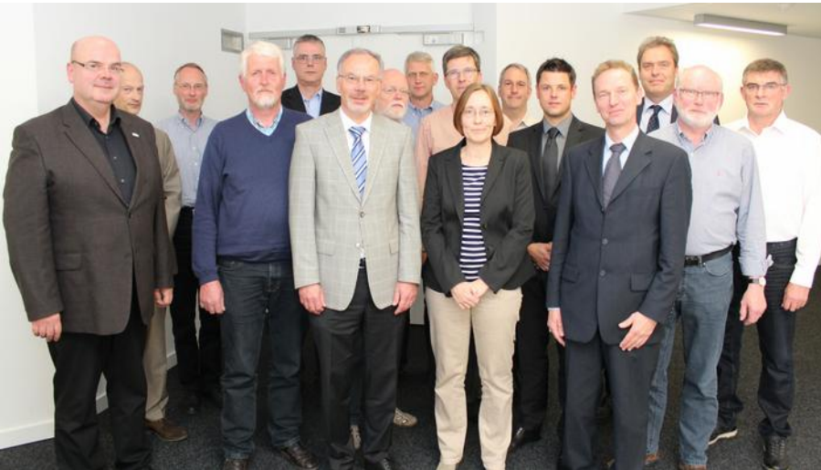
Die Mitglieder des Klimabeirats

Die integrierten Klimaschutzkonzepte der Stadt und des